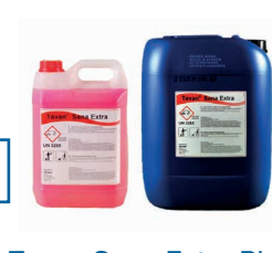
Tevan Sana Extra Plus